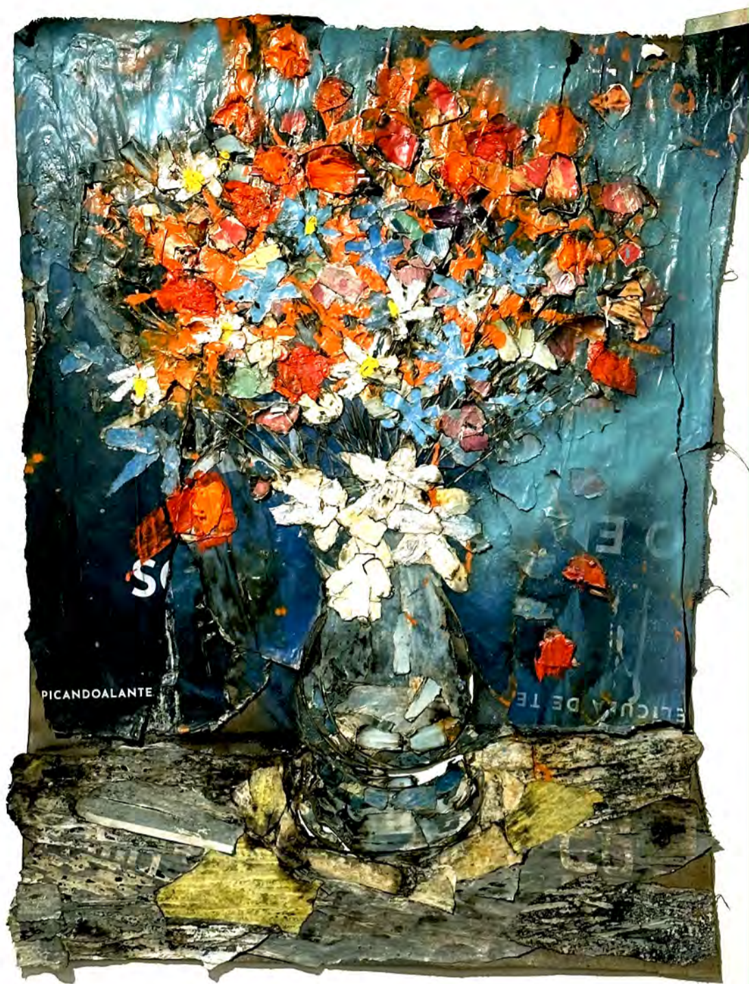
#Van Gogh / Medio mixto sobre tela / 36" x 27" / 2022