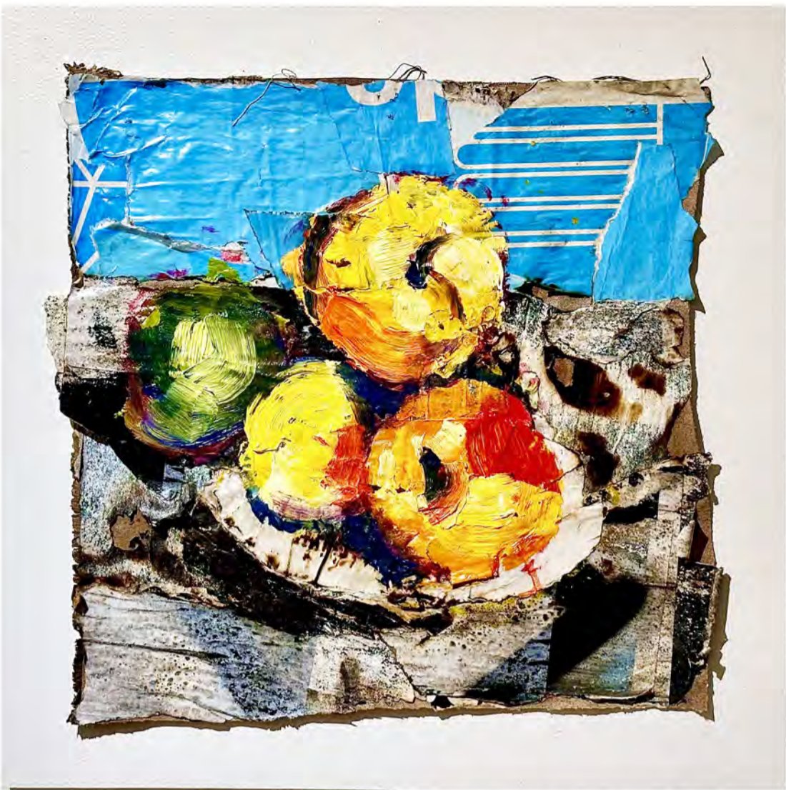
#Cézanne / Medio mixto sobre tela / 18" x 18" / 2022