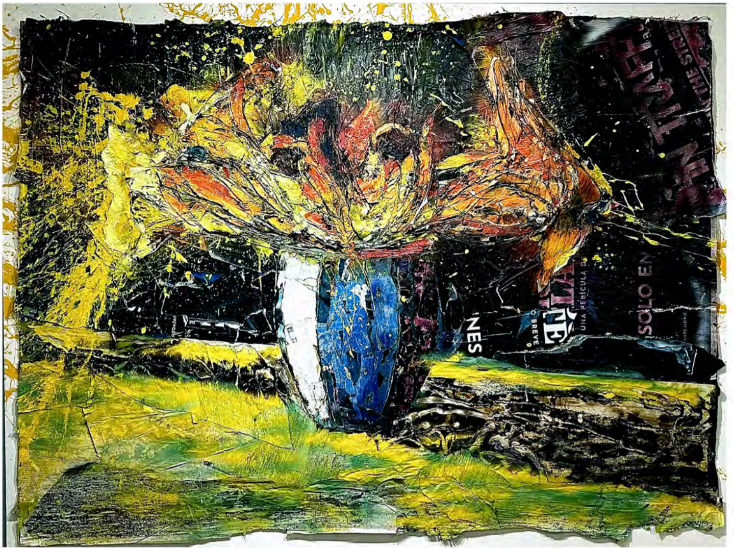
#Rodón / Medio mixto sobre tela / 54" x 72" / 2022