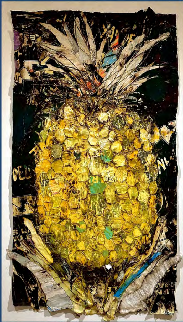
#Quijano / Medio mixto sobre tela / 26" x 43" / 2023