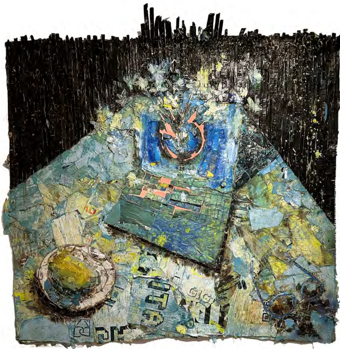
#FKN bodegón / Medio mixto sobre tela / 60" x 65" / 2023

La obra maestra Mi FKN Bodegón es el resultado de un proceso creativo extenso, que refleja todo el aprendizaje acumulado por Norris-Pagan tras crear 9 piezas basadas en los bodegones de pintores célebres, buscando plasmar sus voces. Esta obra emerge como la catarsis final de la propuesta de Norris-Pagán, plasmando en un retrato inanimado su alma, su ánimo y su ser durante estos últimos meses. Utilizando su propia voz y entorno, visibiliza su realidad y alude a su futuro artístico con determinación y ambición. Al igual que el himno popular de Bad Bunny titulado P FKN R , que expresa la solidaridad con la patria y el orgullo boricua de manera exuberante y llamativa, Mi FKN Bodegón busca de igual manera hacer un grito de libertad, desahogándose después de un enfrentamiento constante entre los grandes artistas de la historia y su práctica visual. En esta obra, los colores vibrantes, las formas cuidadosamente dispuestas y los patrones intrincados muestran su dominio de su técnica y su habilidad para jugar con los elementos visuales de la naturaleza muerta. A través de este bodegón, Norris-Pagán expresa su evolución artística y su comprensión del género, revelando su identidad única como creador y su capacidad para reinterpretar y dar vida a una forma de arte clásica en un contexto contemporáneo.