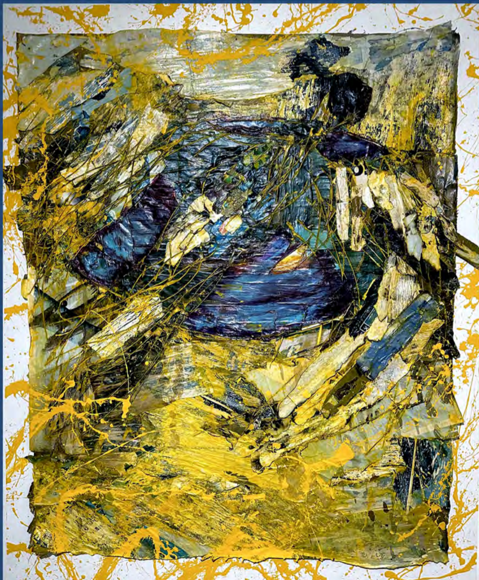
#Bacon / Medio mixto sobre tela / 26" x 43" / 2023